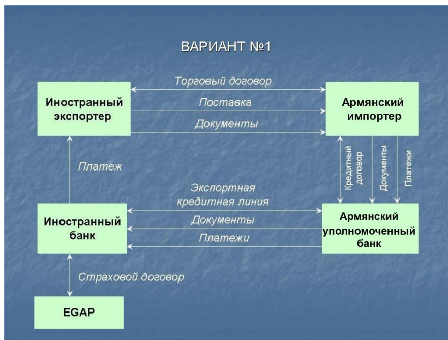
Схема №1. Работа через армянские уполномоченные банки

Согласно схеме №1 инвестор (покупатель), в нашем случае – армянский предприниматель, финансируется чешскими банками не напрямую, а через посредство уполномоченных банков, т.е. кредит выдается армянскому банку, который становится должником и, в свою очередь, финансирует армянского инвестора.